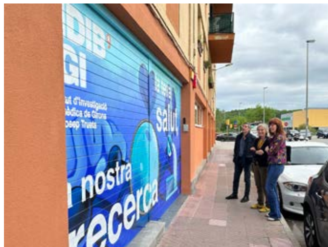
Visita de l'exalcaldessa de Girona, Marta Madrenas, a les instal·lacions de l'IDIBGI al barri de Sant Ponç