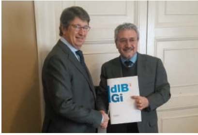
GENER - La Fundació Castell de Perelada impulsa un projecte d'estudi sobre les interaccions entre el metabolisme del ferro i la microbiota