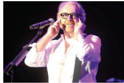
AGOST - Concert solidari del Festival de Cap Roig, a càrrec d'Umberto Tozzi, a benefici de l'IDIBGI per a la cirurgia oncològica