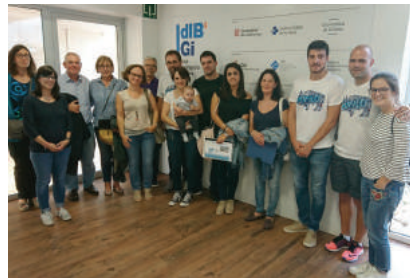
JULIOL - Torneig solidari Homenatge a Iñaki Fernández "Búfalo" per recaptar fons per a la recerca de la Síndrome de Lynch