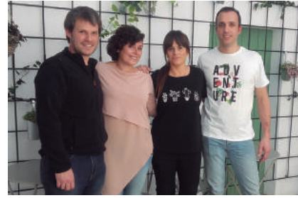
MARÇ - El Jardí del Nèctar de Cassà dona la recaptació de la inauguració a l'IDIBGI