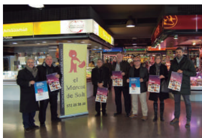
DESEMBRE - L'IDIBGI edita un calendari solidari per recaptar fons per a la recerca biomèdica