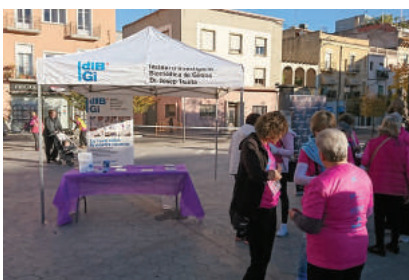
NOVEMBRE - II Cursa de la Dona de Figueres per la lluita contra el càncer de mama