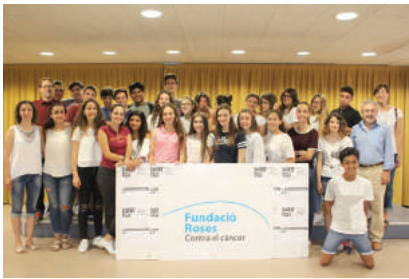
JULIOL - El centre escolar Empordà de Roses recapta 270 euros per a l'IDIBGI per a la recerca de la Síndrome de Lynch