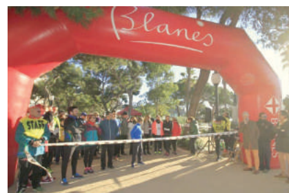
DESEMBRE - Cursa per la Diabetis a Blanes