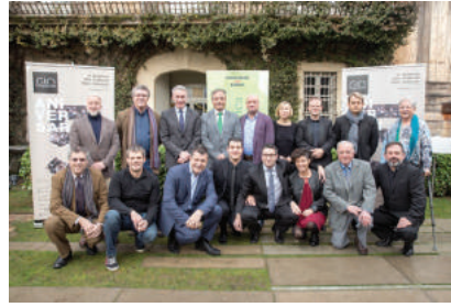
FEBRER - Concert solidari de la GIO Orquestra contra el càncer