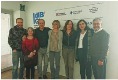
ABRIL - Visita dels representants del Col·legi Oficial de Psicòlegs de Catalunya Delegació de Girona